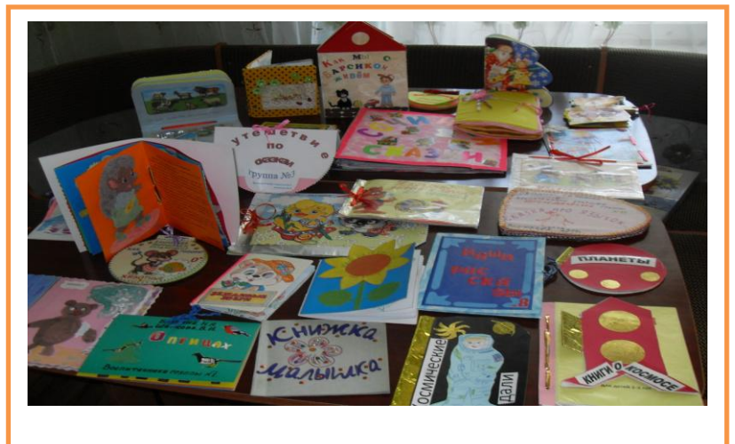
Выставка книжек-малышек детей

- Молодцы ребята, замечательная книжка-малышка у нас получилась. А дома Вы можете сделать свои книжки-малышки на любой сюжет, а потом мы сделаем из них выставку.