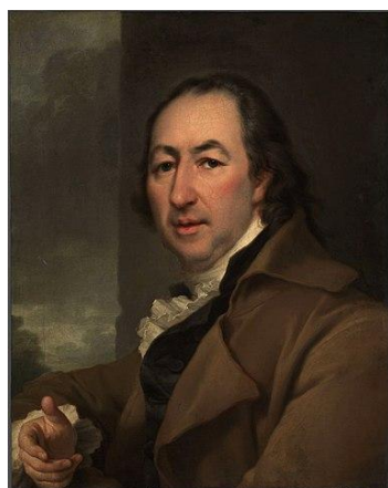
Рис. 2 Николай Иванович Новиков