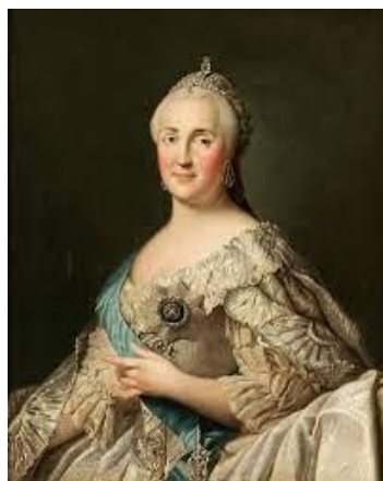
Рис. 1 Екатерина II